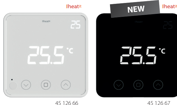
HEATIT Z-TEMP2 Hvit RAL 9003